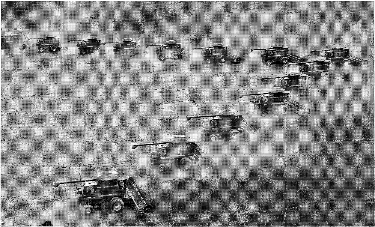
Récolte de soja génétiquement modifié dans une ferme de l'État du Mato Grosso, au Brésil. L'agriculture intensive, tenue par de grands propriétaires, consommatrice d'engrais et de pesticides, intégrée aux échanges mondiaux, est un contre-modèle pour les « objecteurs de croissance ».

engendre une « contre-productivité », dont l'exemple le plus fameux est celui de la vitesse permise par l'automobile : la vitesse réelle est dérisoire si l'on additionne les temps de fabrication, d'entretien, d'embouteillages et de circulation. Illich s'oppose donc à la croissance économique à cause des menaces qu'elle fait peser sur l'environnement, sur l'autonomie des individus, sur leur créativité, sur leur capacité d'intervention politique et sur leur enracinement dans une culture.