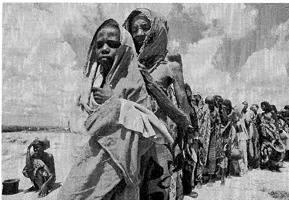
Somaliens dans l'attente d'une distribution de l'aide alimentaire, en 1992. Au-delà d'une répartition équitable des ressources alimentaires dans le monde, les partisans de la décroissance prônent une politique volontariste de réduction des naissances dans le monde par la généralisation du droit à l'avortement, de l'éducation sexuelle, des moyens contraceptifs.

de la Raison, il y a le rejet des Lumières et de l'idée même que puissent être construits des droits universels.