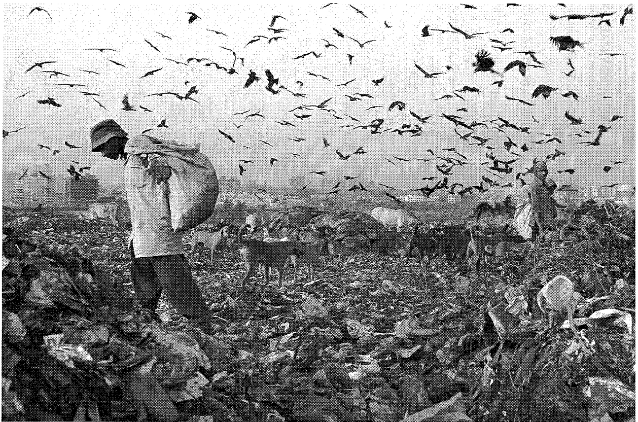
Décharge à New Delhi en 2007. Le traitement et le recyclage des déchets et ordures est un problème environnemental majeur à l'échelle du monde.