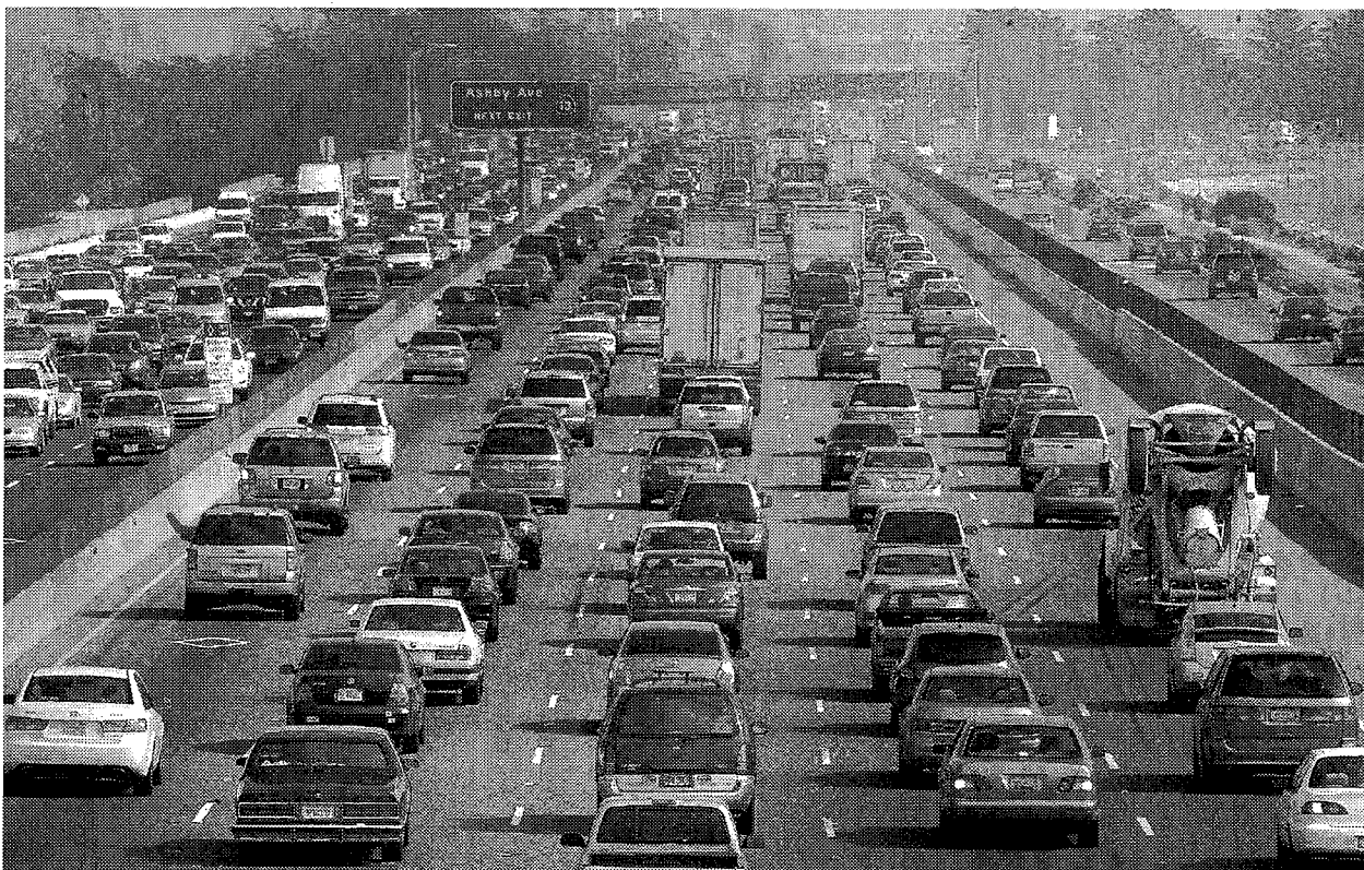
Pour les défenseurs de la décroissance, l'invention de l'automobile est tenue pour une catastrophe culturelle et environnementale majeure : promotrice d'un individualisme obtus, consommatrice d'une énergie fossile polluante, non biodégradable dans nombre de ses composants, à l'origine d'un urbanisme de circulation inhumain et laid.

Ces auteurs récuse ensuite la distinction traditionnelle faite par les économistes du développement entre croissance et développement, la première étant la condition nécessaire mais non suffisante du second, celui-ci intégrant les aspects qualitatifs de l'amélioration du bien-être. Le motif est que, historiquement, on n'aurait jamais constaté l'une sans l'autre, provoquant les mêmes dégâts. Les théoriciens de la décroissance assimilent ainsi l'ensemble de l'économie du développement au paradigme de l'économiste libéral Rostow qui, en 1960, a défini les « cinq étapes de la croissance » conduisant nécessairement au bien-être. Ils assimilent donc ainsi toutes les théories et les stratégies de développement, aussi hétérodoxes qu'elles aient